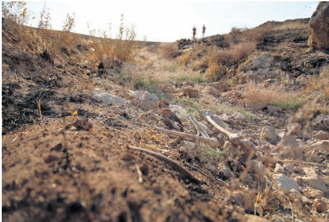
People visit a mass grave for the victims of the Islamic State group in Mosul, Iraq on Thursday, July 1, 2020.

While an investigation is needed to identify the bodies, many believe they were Shiite convicts taken from the local Badoush prison by IS and killed by the militants, shortly after they seized Mosul in June 2014. Iraqi forces recaptured the prison in March 2017. IS al-